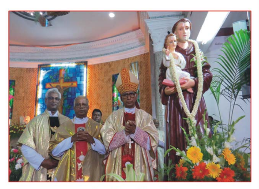
Feast Mass, Attupatti