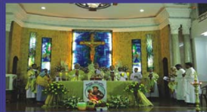
FEAST MASS AT ST. ANTONY'S CHURCH ATTUPATI