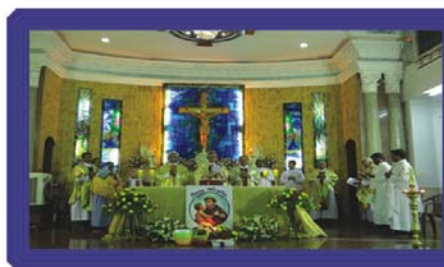
FEAST MASS AT ST. ANTONY'S CHURCH ATTUPATI