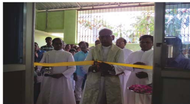
BLESSING AND OPENING OF THE NEW COMMUNITY HALL KARAIKAL

PROCURATOR'S DESK TRIBUNAL COMMISSIONS AND REPORTS